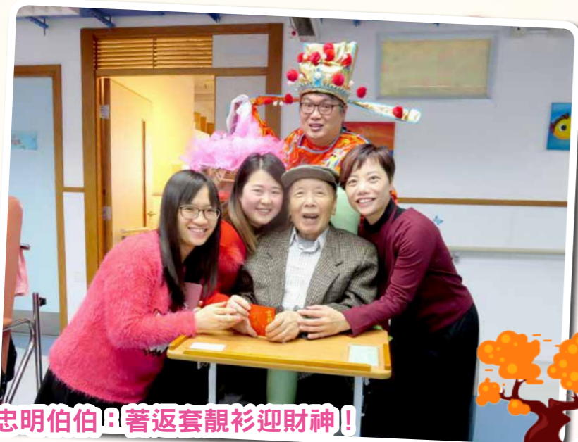
忠明伯伯 著返套靚衫迎財神!

踏入狗年第一日，本院邀請財神爺出來給大家大派利是～正所謂接過財神利是，祈求大家今年身體健康，順順利利！