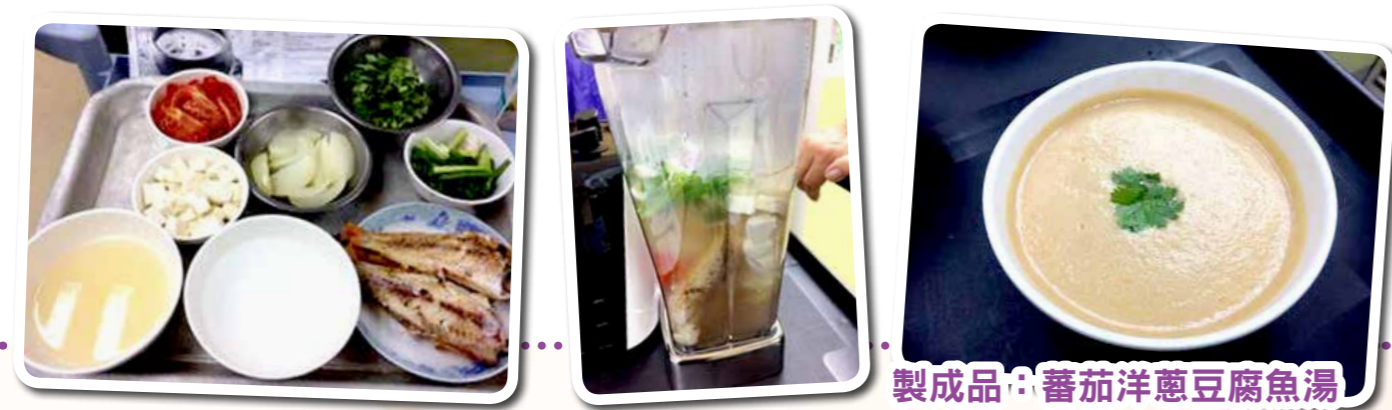
製成品：蕃茄洋蔥豆腐魚湯

院舍長者進食糊餐人數增加，本局持續發掘不同的科技產品，務求優化糊餐的色、香、味、型。廚師試用「自然養生機」，發現糊餐幼滑度提升、保留菜色的味道及營養。長者及家屬試食，十分欣賞。故本局未來逐步引入自然養生機，優化有型餐膳。